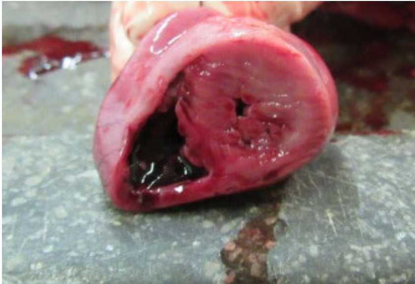
Foto 3: Dwarse doorsnede doorheen het hart met een sterk verdikt aspect van de linker ventrikelwand en het septum.

Ook bij de katten werd de diagnose van parvovirose één maal vastgesteld bij een kitten. Een ander kitten had op autopsie een duidelijk beeld van bacteriële sepsis en hierbij werd Streptococcus gallolyticus geïsoleerd. Bijkomend had dit kitten ook typische macroscopische en histologische letsels van hypertrofische cardiomyopathie (Foto 3). Bij een derde kitten werd op autopsie de diagnose van otitis interna vastgesteld.