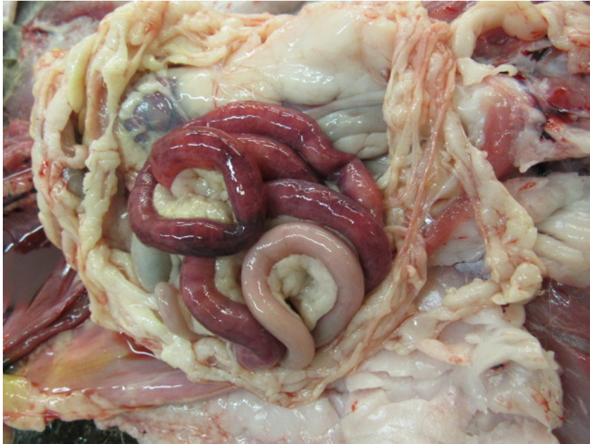
Foto 1: Segmentele hemorrhagische enteritis ten gevolge van parvovirus.

Bij de volwassen honden stierven twee dieren aan de gevolgen van hartfalen. Bij één hond werd dit veroorzaakt door een aangeboren aortastenose, de andere hond stierf aan de gevolgen van een degeneratieve aandoening: endocardiose van de tricuspidalisklep (Foto 2). Bij slechts één dossier werd er geen duidelijke oorzaak van sterfte gevonden.